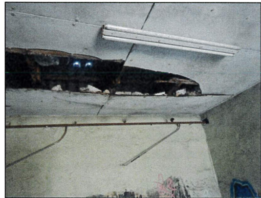
Bild 14: Garagenkomplex, Nordflügel, Garage C, Probe 23547-04, Asbestzement-Decke mit Styropor-Dämmauflage.