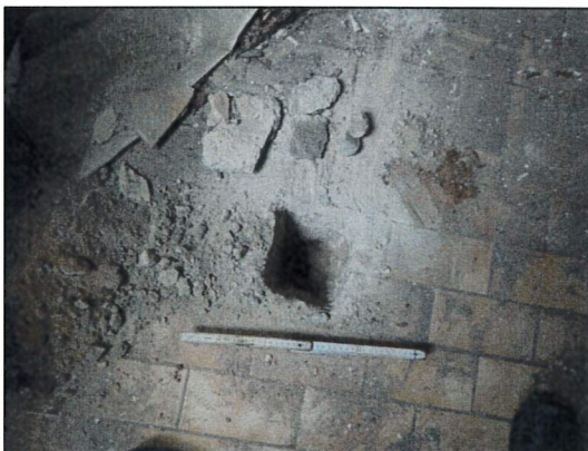
Bild 35: Wohnhaus II, EG, WC, Probeöffnung 23547-44, Fußboden ohne Dämmstoffe und Isolierpappen.