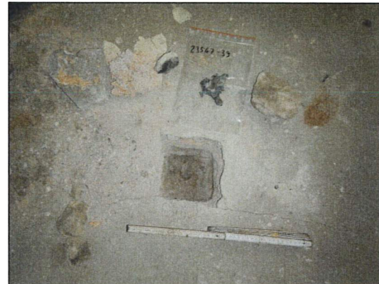
Bild 32: Bürogebäude II, EG, WC 1, Probe 23547-39, asbestfreie Bitumenpappe im Fußboden.