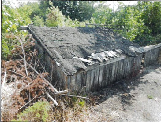
Bild 37: Überdachung ehem. Kellereingang südlich Heizhaus, Probe 23547-46, asbesthaltige Isolierpappe „Ruberoid“ als Dacheindeckung.