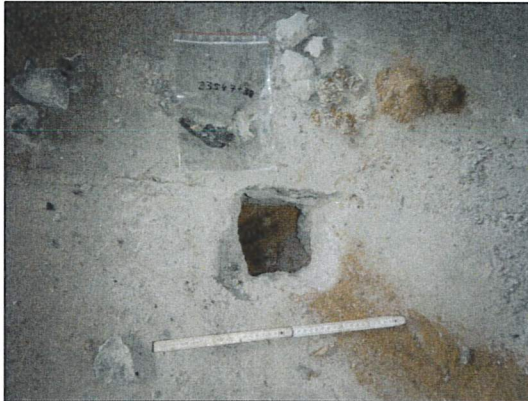
Bild 31: Lagerhalle II, Raum, Probe 23547-38, Fußbodenfugen mit asbestfreier Fugenvergussmasse.