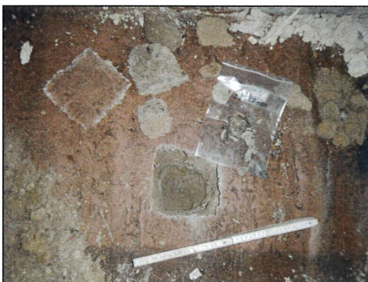
Bild 17: Bürogebäude I, EG, Raum I (Büro), Probe 23547-17, asbestfreie Teerpappe im Fußboden.