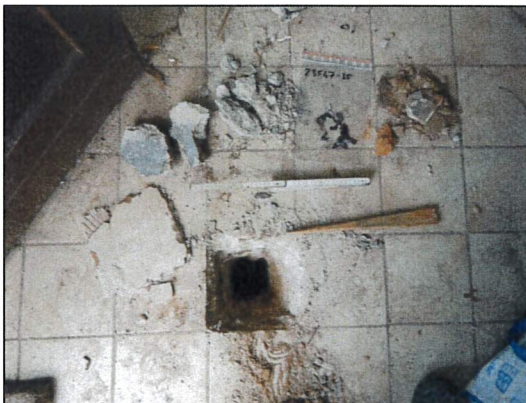
Bild 29: Laube U, Wohnraum, Probe 23547-35, asbestfreie Teerpappe im Fußboden.