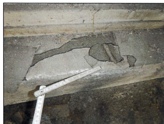
Bild 18: Bürogebäude I, EG, Raum K (Werkstatt), Probe 23547-12, asbestfreie Teerpappe als Horizontalsperre zwischen Betonsockel und Sandwich-Leichtbauplatte.