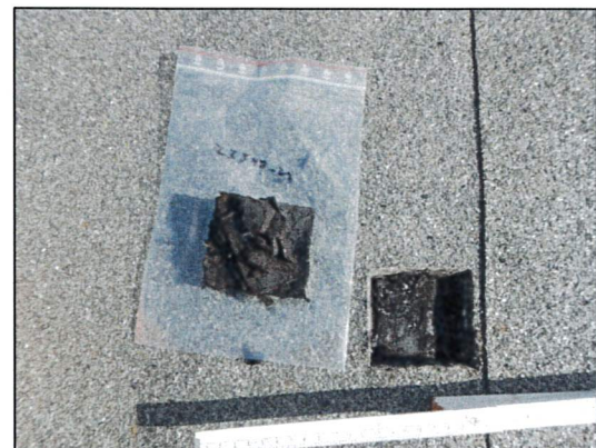
Bild 24: Laube C, Dach, Probe 23547-21, Teerpappe mit geringen Asbestgehalten als Dacheindeckung.