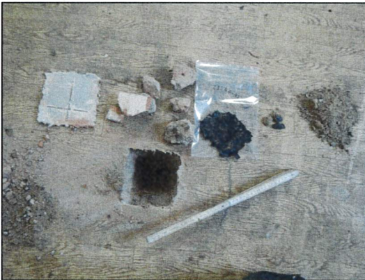
Bild 21: Wohnhaus I, EG, Wohnraum 4, Probe 23547-15, asbestfreie Teerpappe im Fußboden.