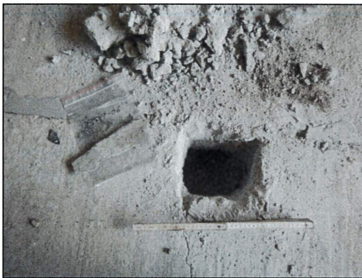
Bild 15: Lagerhalle I, Raum, Probeöffnung 23547-06, Fußbodenfugen mit asbestfreier Fugenvergussmasse.