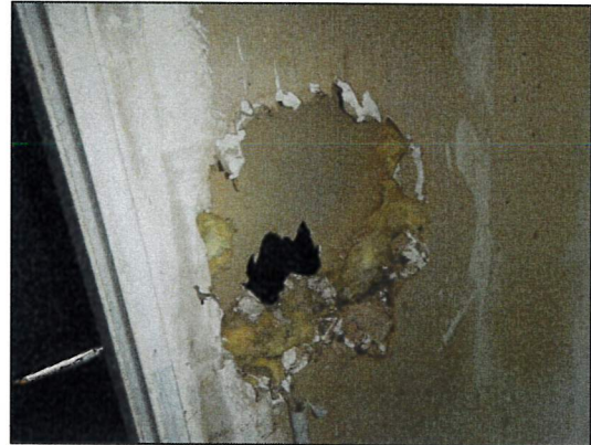
Bild 38: Heizhaus, Wand zwischen nördlichen und südlichen Raum, Gipskarton-Leichtbauwand mit Mineralwolle-Kerndämmung.