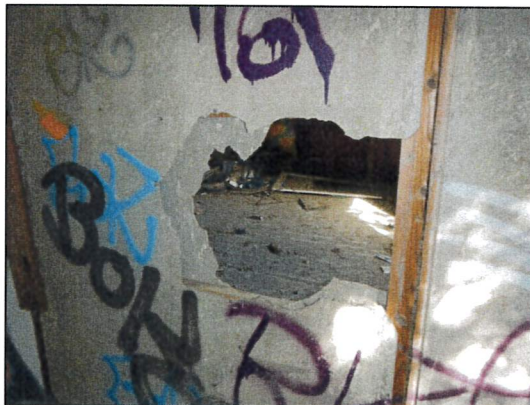
Bild 41: Lagerhalle II, Asbestzement-Leichtbauwände (doppelschalig ohne Kerndämmung).