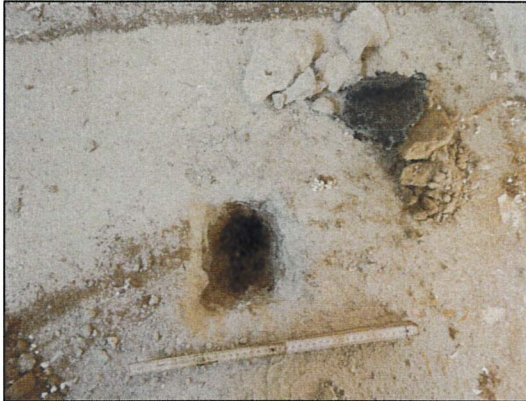
Bild 25: Laube C, Küche, Probeöffnung 23547-23, Fußboden ohne Dämmstoffe und Isolierpappen.