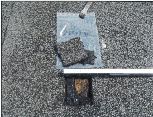
Bild 33: Bürogebäude II, Dach, Probe 23547-42, asbestfreie Teerpappe als Dacheindeckung.