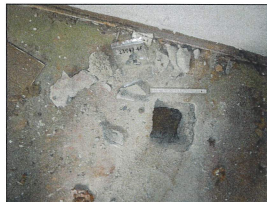
Bild 36: Wohnhaus II, EG, Wohnraum 1, Probe 23547-45, Teerpappe mit geringen Asbestgehalten und HWL im Fußboden.