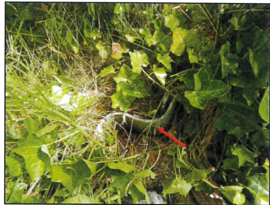
Bild 40: Gartensparte, Well-Asbestzement-Zuwegungen teilweise in den Gärten.