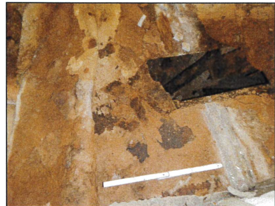
Bild 22: Wohnhaus I, EG, Wohnraum 1, Probeöffnung 23547-16, Fußboden ohne Dämmstoffe und Isolierpappen.