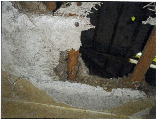
Bild 39: Bürogebäude I, EG, Raum E (Büro), HWL-Decke mit Mineralwolle-Dämmlage.