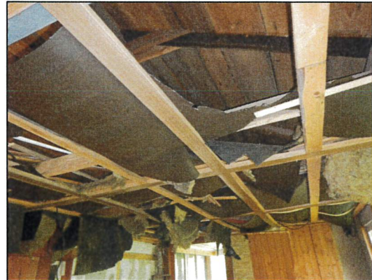
Bild 26: Laube G, Wohnraum, Probe 23547-27, Teerpappe mit geringen Asbestgehalten und Mineralwolle als Dämmlage oberhalb ehemaliger Zwischendecke.