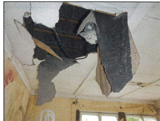
Bild 34: Wohnhaus II, Dachboden, Probe 23547-43, asbestfreie Teerpappe, Mineralwolle und Plathern (teilweise) als Dämmauflage oberhalb Presspappen-Zwischendecke