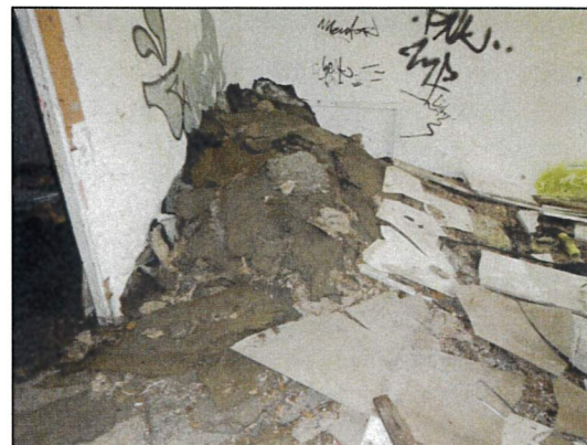
Bild 30: Bürogebäude II, EG, WC 2, Probe 23547-37, Teerpappen mit geringen Asbestgehalten, Asbestzementplattenbruchstücke und Styropor, lose liegend