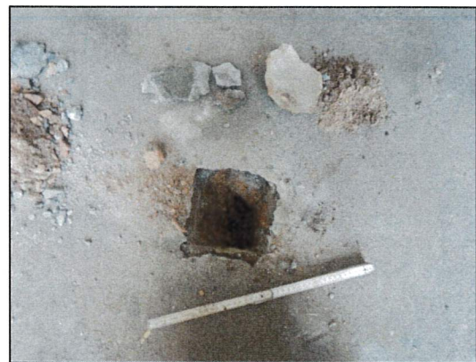
Bild 16: Garagenkomplex, Garage F, Probeöffnung 23547-07, Fußboden ohne Dämmstoffe und Isolierpappen.