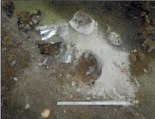
Bild 19: Bürogebäude I, EG, Raum K (Werkstatt), Probe 23547-13, Fußbodenfugen mit asbestfreier Fugenvergussmasse.