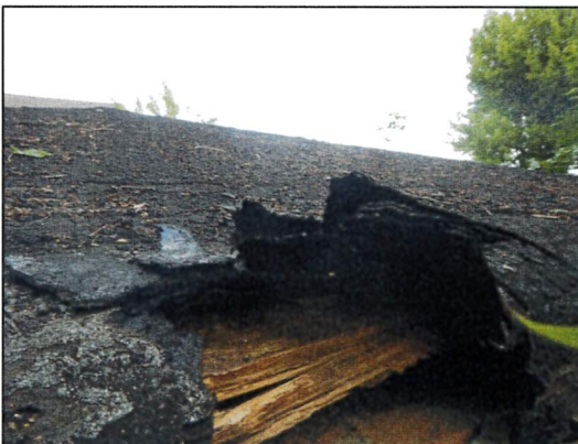
Bild 23: Wohnhaus I, Dach, Probe 23547-18, asbestfreie Teerpappe als Dacheindeckung.