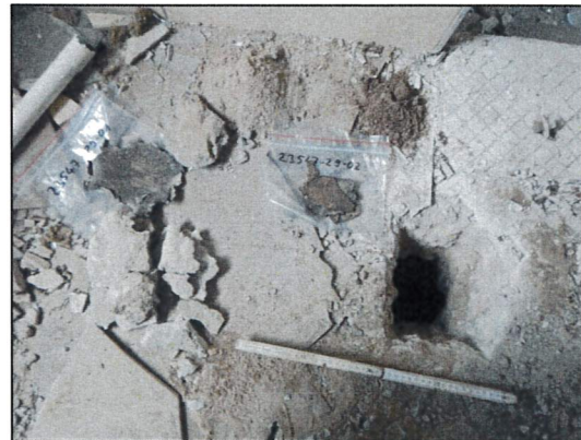
Bild 28: Laube F, Bad, Probe 23547-29, asbestfreie Teerpappe (oberer und unterer Horizont) im Fußboden.