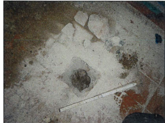
Bild 20: Bürogebäude I, EG, Raum D (Bad), Probeöffnung 23547-14, Fußboden ohne Dämmstoffe und Isolierpappen.