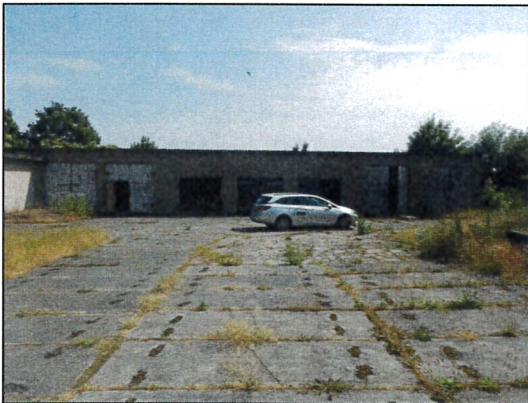
Bild 3: Gebäudeansicht Garagenkomplex (Nordflügel) von Südwesten.